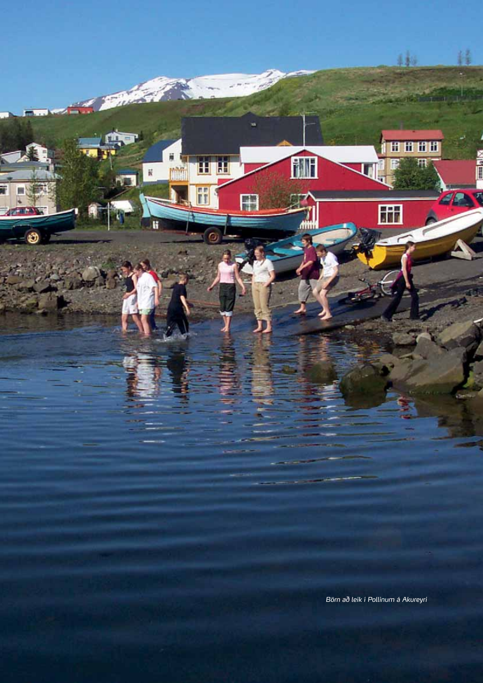
Börn að leik í Pollinum á Akureyri