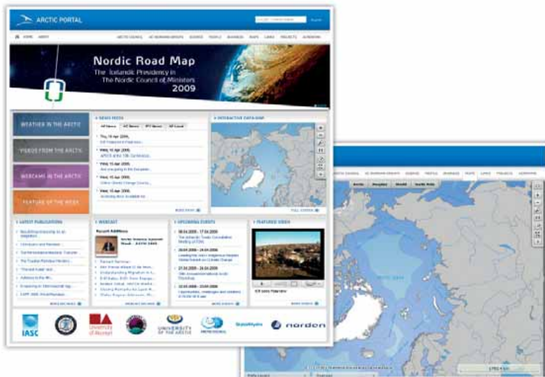
Skjámyndir af Norðurslóðagáttinni www.arcticportal.org

Stefnt er að frekari eflingu Norðurslóðagáttarinnar með fjölgun samstarfsaðila og þróun nýrra þátta. Meðal fyrirliggjandi verkefna má nefna upplýsingamiðlun um fyrirhugaðar stórfamkvæmdir á norðurslóðum og umhverfisáhrif þeirra þar sem hægt verður að koma á framfæri athugasemdum og spurningum til viðkomandi fyrirtækja og stjórnvalda. Í undirbúningi er þróun vefkennslusvæðis í samvinnu við Háskólann í Edmo nton í Kanada og fleiri skólastofnanir innan Háskóla norðursins, sem þjóni sérstaklega þörfum smærri byggðarlaga og auðveldi þeim aðgang að æðri menntun. Jafnframt er unnið að opnun sérstaks samfélagstorgs á vefnum, „community square“, þar sem norðurslóðasamfélög og frumbyggjahópar fá eigin vefsvæði með aðgangi að vefbúnaði, vefmiðlum og umræðutorgum sem auðveldi varðveislu og þróun tungumála þeirra og menningar í breyttu umhverfi.