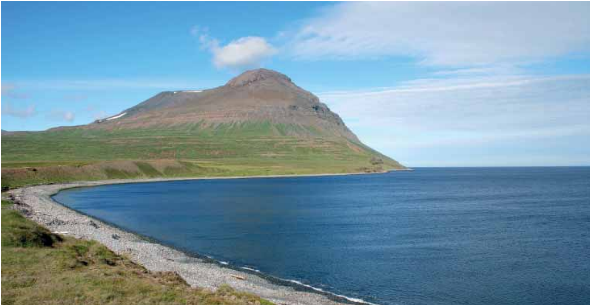
Gunnólfsvík á suðaustanverðu Langanesi

og viðbragðsgeta við bráðamengun vegna olíuslysa er frumskilyrði fyrir slíkri starfsemi. Meta þarf af kostgæfni þau áhrif sem aukin umferð olíuskipa um íslenskt hafsvæði kann að hafa á viðkvæmt vistkerfið við landið.