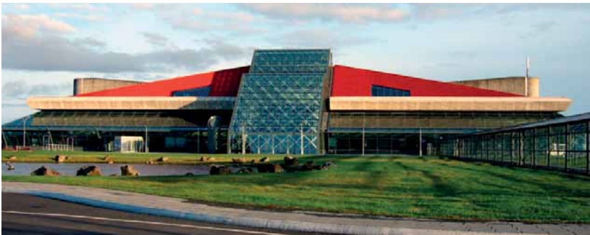
Flugstöð Leifs Eiríkssonar

Með fluginu og stórstígum framförum í flugtækni og farþegaflutningum á síðari hluta tuttugustu aldar gjörbreyttust tengsl Íslands við umheiminn á örfáum áratugum. Fyrir þann tíma var Ísland tiltölulega einangrað jaðarsvæði á norðurhvara sem hafði litla þýðingu fyrir umheiminn aðra en þá sem fólst í fiskimiðunum.