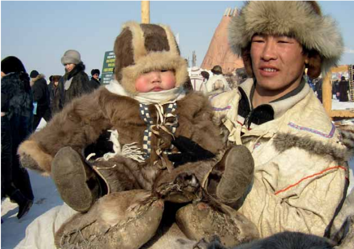
Frumbyggjar í Siberíu

Íslendingar teljast ekki til frumbyggja samkvæmt þessari skilgreiningu þótt þeir séu vissulega frumbyggjar eigin lands. Eftir sem áður eiga Íslendingar að mörgu leyti samleið með frumbyggjum norðursins í menningarlegu tilliti enda hefur lífsbaráttan á norðurslóðum sett mark sitt á menningu þjóðarinnar með svipuðum hætti og hún hefur mótaði menningu frumbyggja. Reyndar eru Inúítar á Grænlandi ekki í ósvipaðri stöðu og Íslendingar, hvað þetta varðar, þótt þeir séu oft flokkaðir með frumbyggjum.