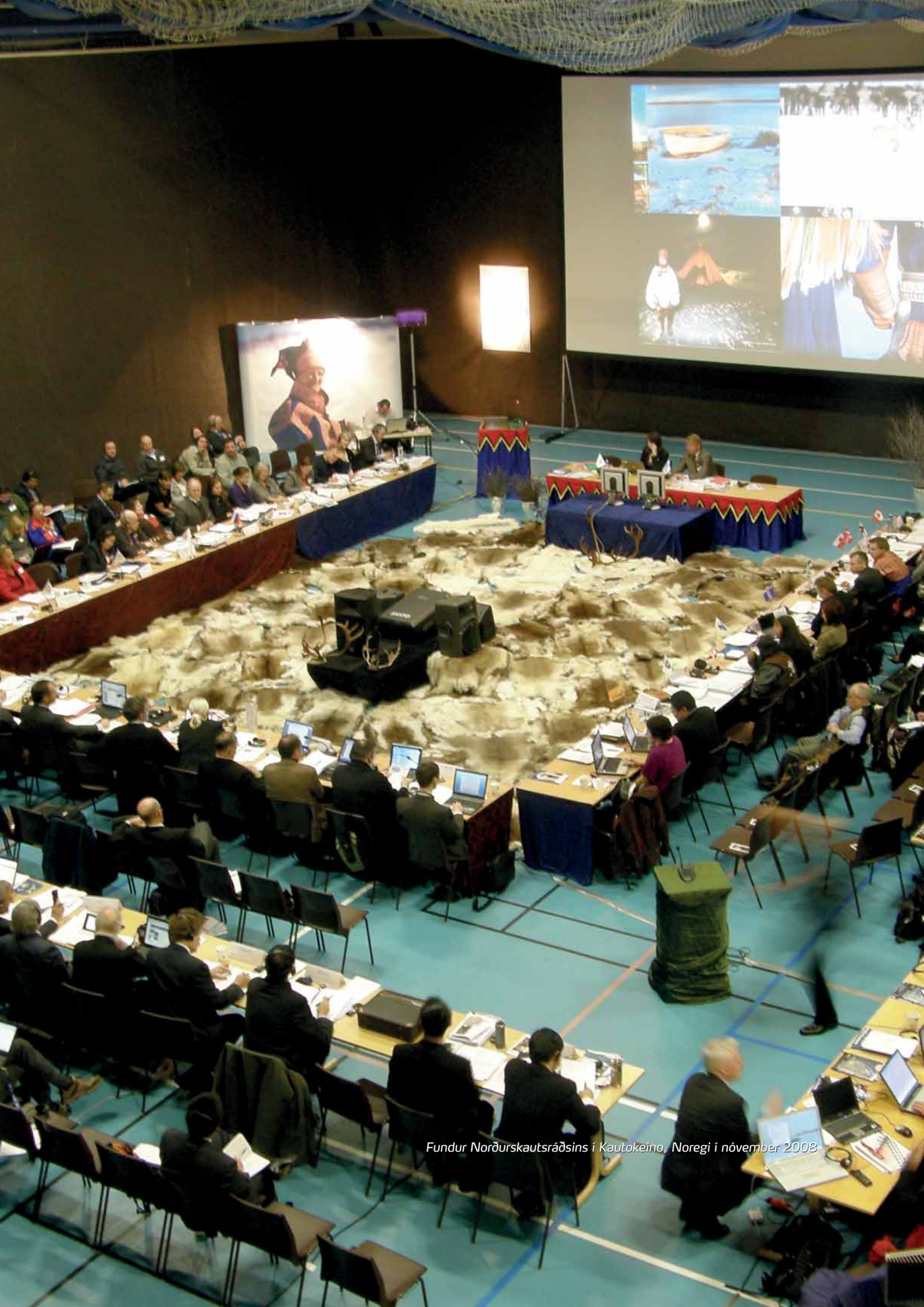
Fundur Norðurskautsráðsins í Kautokeino, Noregi í nóvember 2008