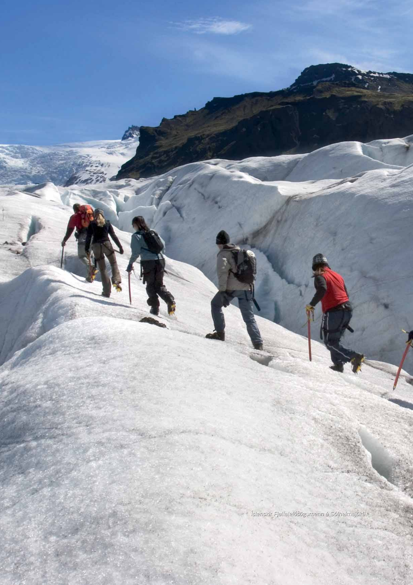
Íslenskir Fjallaleiðsögumenn á Sótheimajökli