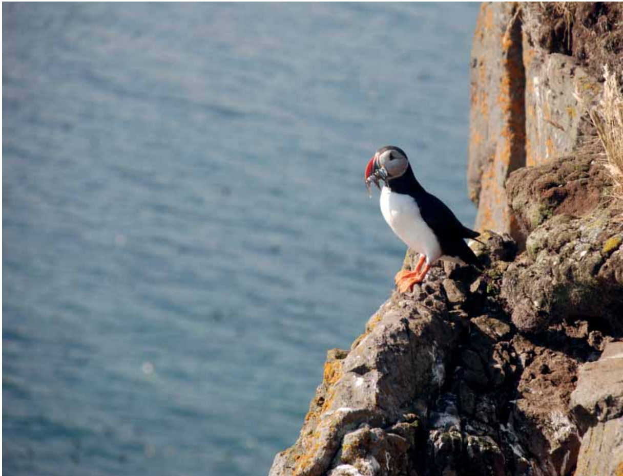
Lundi með æti í Grímsey, Steingrímsfirði

Aðildarlönd Norðurskautsráðsins hafa skipst á um að hýsa skrifstofu EPPR-hópsins og hefur hún yfirleitt fylgt formennsku ráðsins. Í formennskutíð Norðmanna, 2006–2009, hefur starfshópurinn því haft aðsetur hjá Siglingastofnun Noregs. Allar frekari upplýsingar um starfshópinn, skýrslur og annað útgefið efni er að finna á vefsíðu starfshópsins: http://arctic-council.org/working_group/eppr