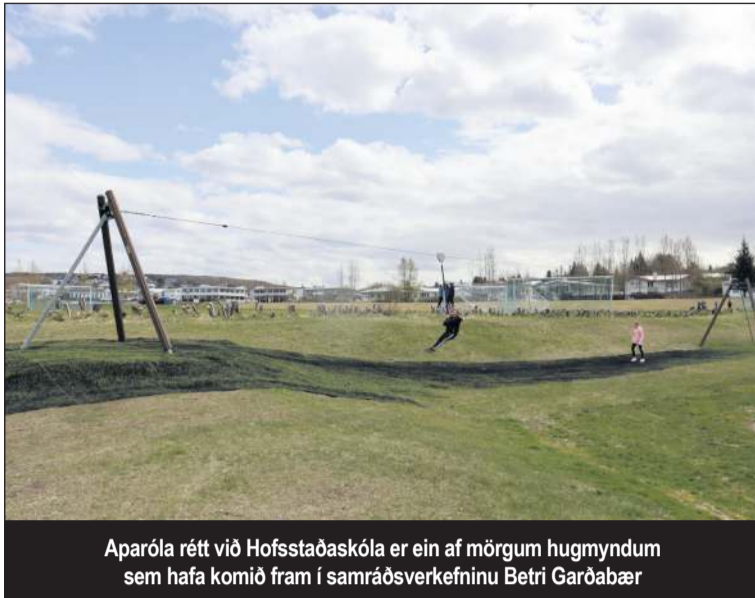
Aparóla rétt við Hofstaðaskóla er ein af mörgum hugmyndum sem hafa komið fram í samráðsverkefninu Betri Garðabær