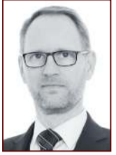
Frímann 897 2468