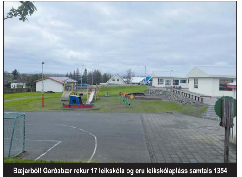
Bæjarbóli! Garðabær rekur 17 leikskóla og eru leikskólapláss samtals 1354

Bæjarráð vísaði minnisblaðinu til umfjöllunar leikskólaneftdar.