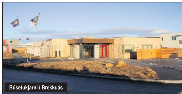
Búsetukjarni í Brekkubæ

Hækkun á áætluðu framlagi til Garðabæjar nemur 283.577 þkr.