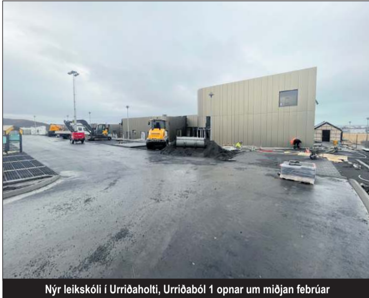
Nýr leikskóli í Urriðaholti, Urriðaból 1 opnar um miðjan febrúar

Leikskólaplássum er úthlutað miðlægt frá fræðslu- og menningarsviði. Börn með lögheimili í Garðabæ hafa forgang í leikskólapláss í öllum leikskólum innan sveit-