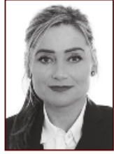
Kristín 699 0512

Stapahrauni 5, Hafnarfirði Sími: 565 9775 www.uth.is - uth@uth.is