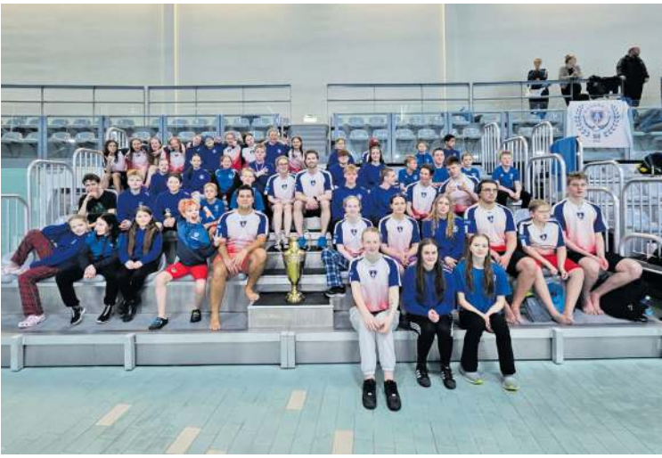
Glæsilegur hópur Ármenna sem sigraði Reykjavíkurmestaramótið í sundi 2024