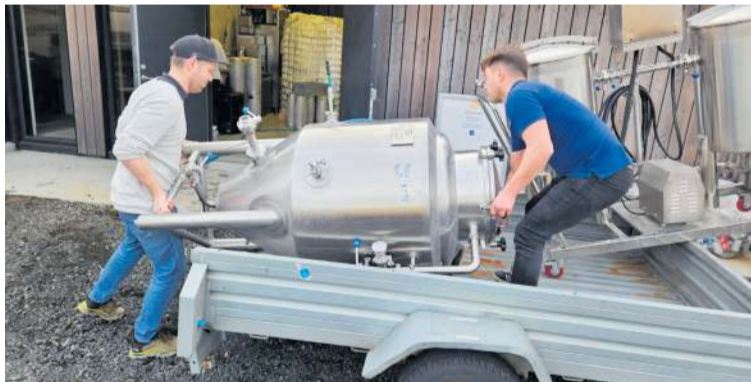
Bjórgerðartækjum bjargað úr húsnæði fyrirtækisins 22.10 við Hafnargötu í Grindavík. Utan við húsnæðið hefur myndast djúp og mikil sprunga.

Kvikugangurinn sem myndaðist í hamförunum á föstudag nær frá Kálfellsheiði í norðri og liggur rétt vestan Grindavíkur og í sjó fram í