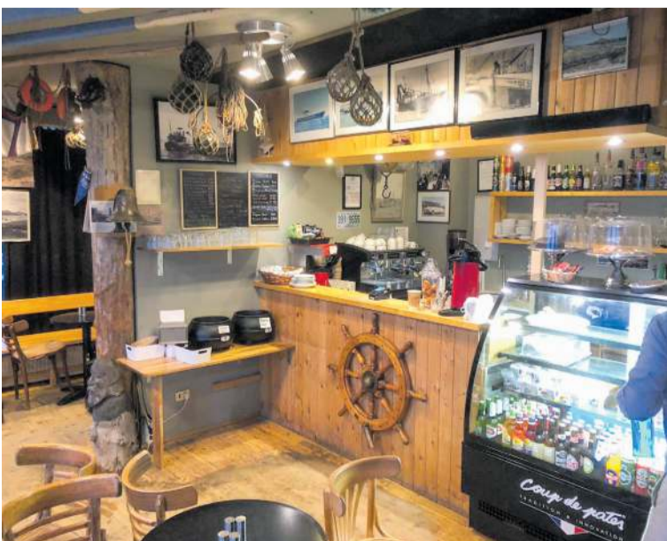
Humarsúpan á Bryggjunni varð svo vinsæl að gerð var heimildarmyndin Lobster Soup.

Viðtalið var tekið áður en jarðhræringarnar fóru yfir á nýtt stig föstudaginn 10. nóvember og settu framtíð Grindavíkur í óvissu.