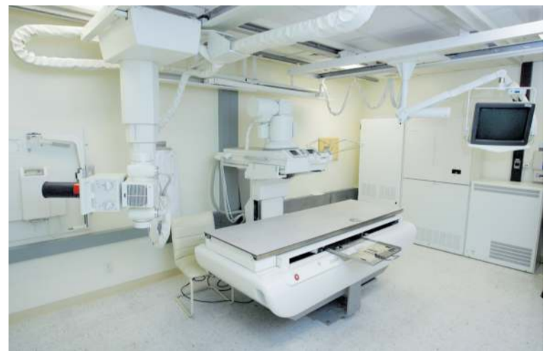
Svona var umhofs í gamla hersjúkrahúsinu á Ásbrú í nóvember 2008.

á Ásbrú og mikil uppbygging í vendum. „Það er gaman að vera hluti af þessari þróun og að fá tækifæri til að vera með menningartengda starfsemi hér í hjarta hverfisins en þess má geta að húsið verður búið þannig að möguleiki