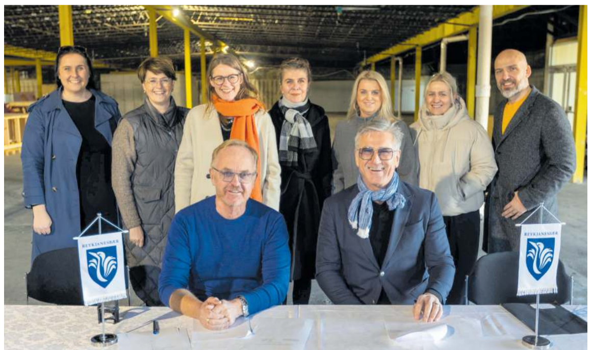
Frá undirritun samninga milli Reykjanesbæjar og Björtuvíkur um leigu á húsnæðinu til næstu 25 ára.