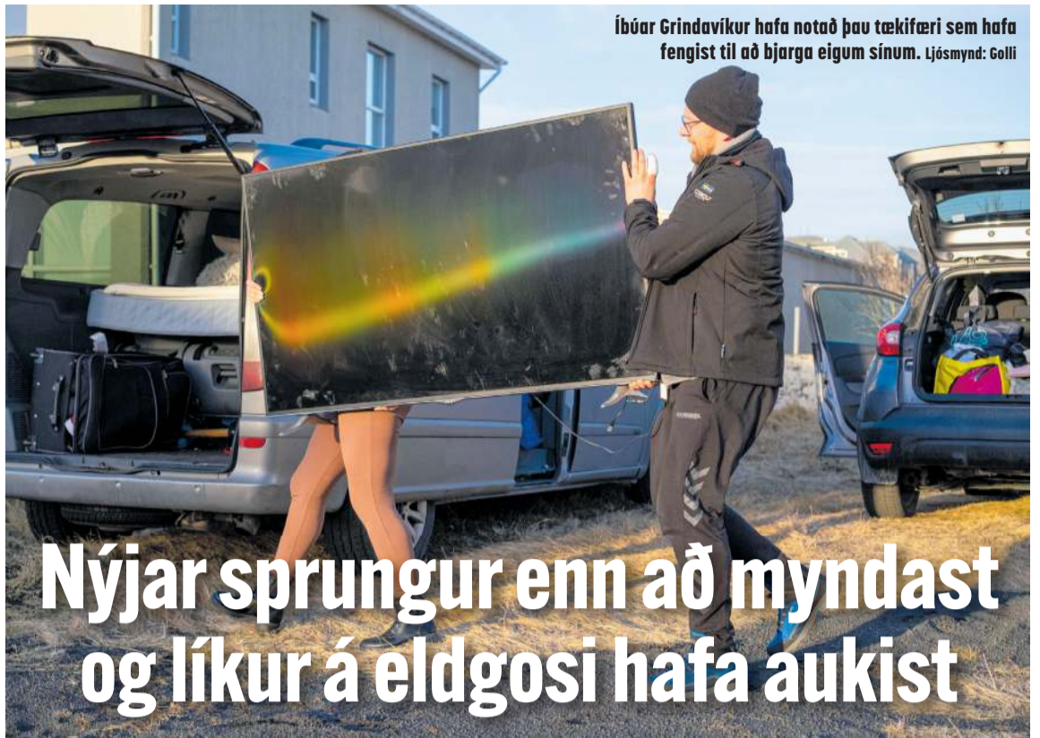
Íbúar Grindavíkur hafa notað þau tækifæri sem hafa fengið til að bjarga eignum sínum.