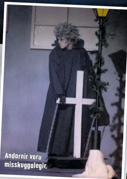
Andarnir voru misskuggalegir.