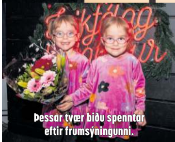
Þessar tvær biðu spennar eftir frumsýningunni.