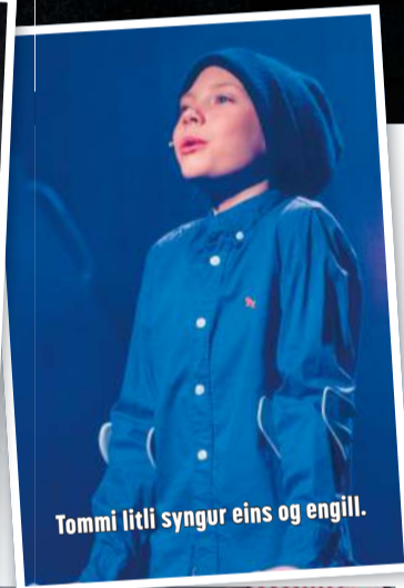
Tommi litli syngur eins og engill.