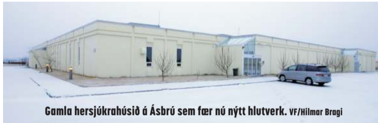
Gamla hersjúkrahúsið á Ásbrú sem fær nú nýtt hlutverk.

„Þetta mun umbylta aðstöðu safnanna til hins betra. Þegar búið verður að innrétta húsið verður hér nútímaleg og fagleg aðstaða til að varðveita, vinna með og rannsaka safnkostinn. Eitt af því mikilvægast sem hér mun nást fram er að safngripum verður skipað í mismunandi rými og þeir varðveittir við aðstæður sem henta hverjum gripaflokki. Og það skiptir máli. Það er nefnilega svo að safnkostur þessara tveggja safna er einstakur. Listasafnið varðveitir ýmis meistaraverk íslenskrar listasögu, m.a. verk eftir Kjarval og Gunnlaug Blöndal, en ekki síður framlög Suðurnesjanna til myndlistararfsins,“ segir