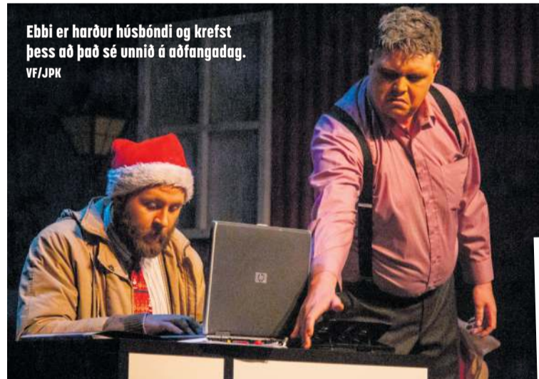
Ebbi er harður húsbóndi og krefst þess að það sé unnið á aðfangadag.

skylduna sína, vinina og ástina sem hann hafði gefið upp á bátinn – og síðast en ekki síst kemst hann í jólaskap.