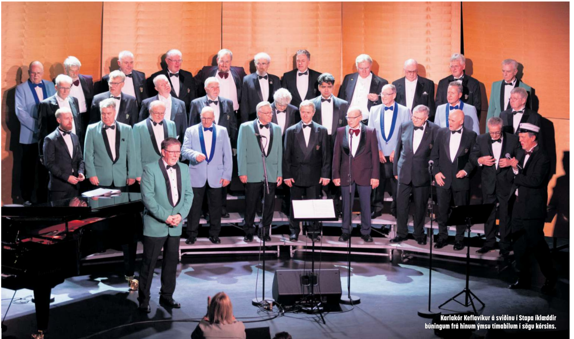
Karlakór Keflavíkur á sviðinu í Stapa íklæddir búningum frá hinum ýmsu tímabilum í sögu kórsins.