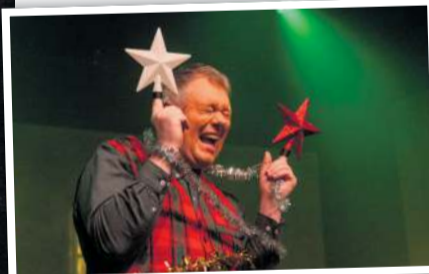
Regnbogaraddir settu svip á sýninguna.