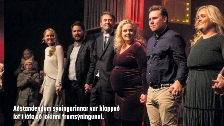
Aðstandendum sýningarinnar var klappað lof í lófa að lokinni frumsýningunni.