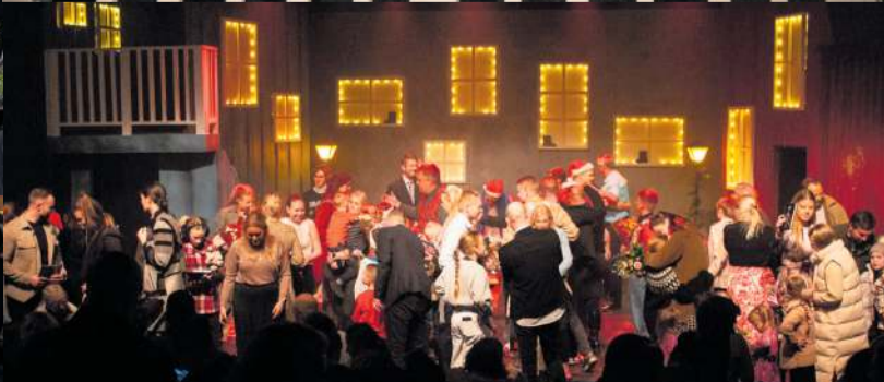
Sýningargestir hópuðust á sviðið eftir frumsýninguna og samglöddust leikurunum.